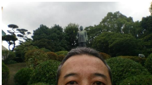
西郷どんを頭の上に・・・(笑)