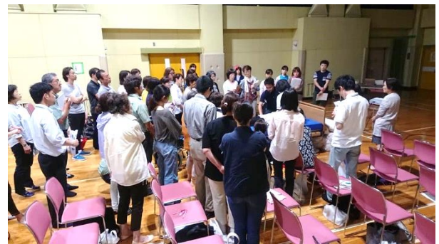
介護サービス事業所(介護技術)研修 テーマ『拘縮予防の介助とポジショニング』