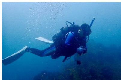
のんびり海中散歩 介護支援専門員