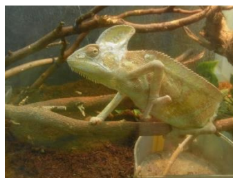
沖縄「こどもの国」 この子で癒されてきました ～介護福祉士～