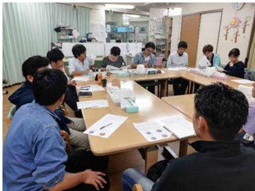
9月20日デイ部会 「利用者確保の営業他 情報共有会」