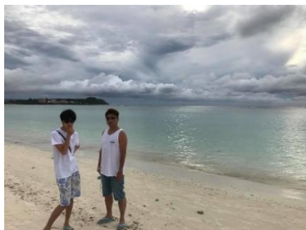
Guam島タモンビーチにて 介護支援専門員