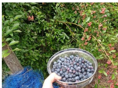
我が家の庭で採れた、 完全無農薬のブルーベリー！ ～福祉用具専門相談員～