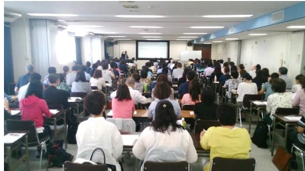
第1回介護支援専門員共催研修 「現場で活かすプレゼンテーション力」 ～利用者(家族)を動機づける伝え方～