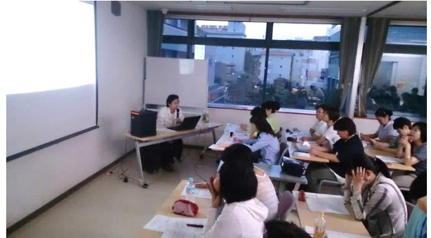
訪問介護部会全体研修 「自立生活支援のための見守りの支援 (老計10号1-6)の明確化」