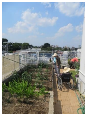
なかなか休みが取れず 職場屋上にて趣味の菜園 手入れで夏を満喫・・・たまにはこんな夏の ひと時も悪くないなと思いつつ、 夏・秋の収穫がとても楽しみ！