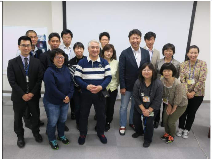
今年度役員会メンバーです！