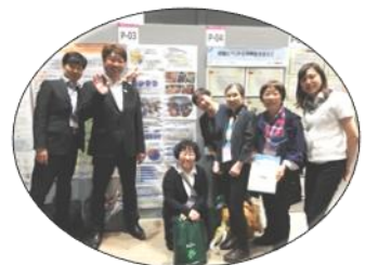
応援に来て下さった方々、ありがとうございました。