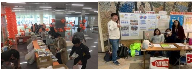
〈オレンジバレーンフェスティバル〉